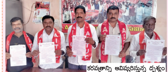
కరవలసాని ఆవిష్కరణను దృశ్యం