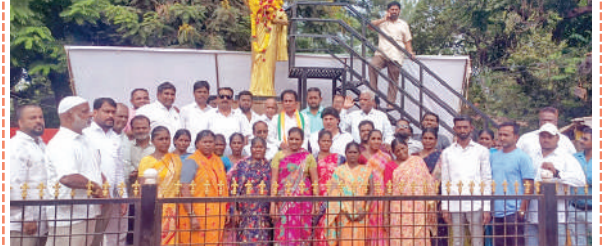
జహీరాబాద్, నవంబరు 1, ప్రభాతవార్త: మాజీ ప్రధాని మంత్రి ఇందిరా గాంధీ వర్షం వేడుకలను గురువారం కాంగ్రెస్ పార్టీ ఆధ్వర్యంలో ఘనంగా జరుపుకున్నారు.