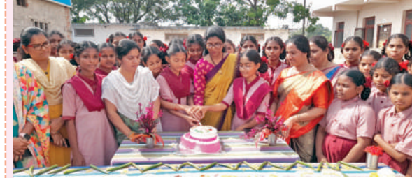
నలభై మంది నిర్వహించబడుతున్న విద్యార్థులు