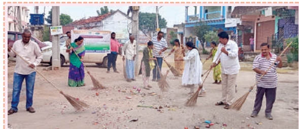
స్వచ్ఛతలో పాల్గొన్న మున్సిపల్ చైర్మన్లకు ఆటల రజతవెంకన్న